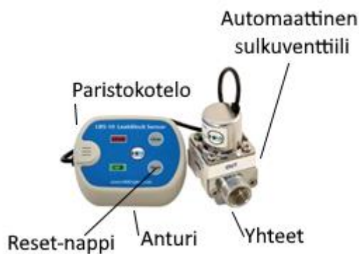
SAFE B-malli paristolla