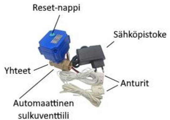
SAFE E-malli pistokkeella