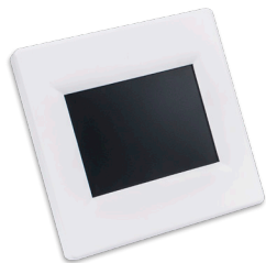
Ohjelmoitava TFT-termostaatti (26 202 01)