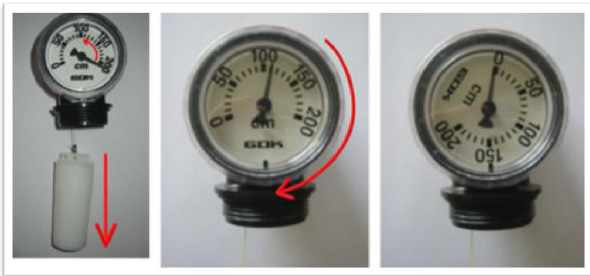
Kuva 1. Mittarin asteikon siirtäminen

Mittarin asteikkoa voidaan siirtää kääntämällä käsin mittarin läpinäkyvää muovikehystä kuvasarjan havainnollistamalla tavalla.